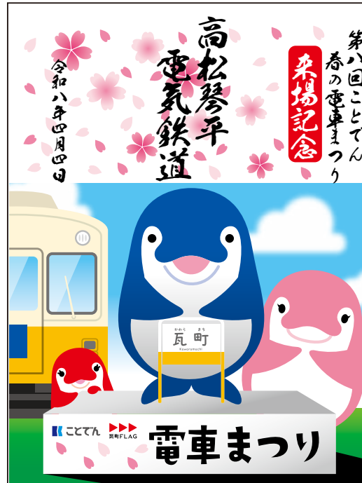
4月4日限定 瓦町FLAG屋上で販売