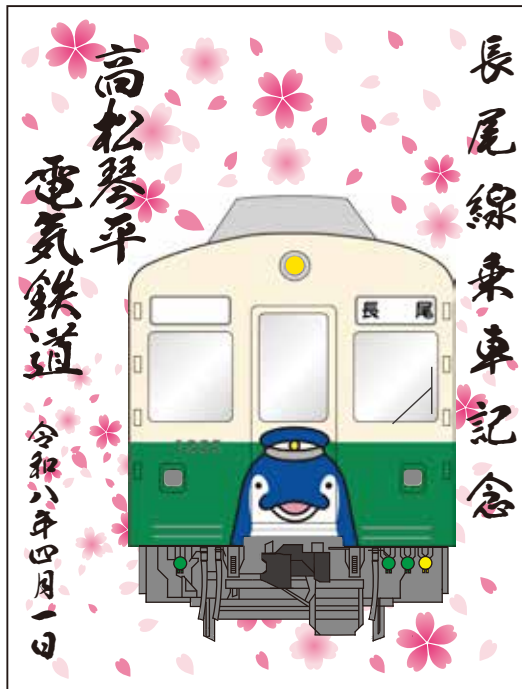
4月1日限定 長尾駅で販売