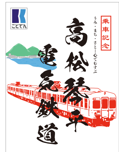
通年デザインは3日間とも販売

鉄印帳1冊+乗車券1人分ご提示で、鉄印1種類につき1枚販売 同じ種類の鉄印を2枚購入する場合は、鉄印帳+乗車券が2セット必要です。