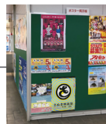
▲瓦町駅駅貼りポスター