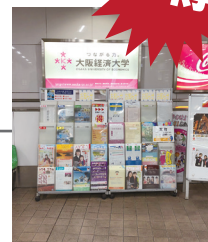
▲瓦町駅パンフレットラック