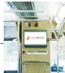
▲市内電車ビジョン