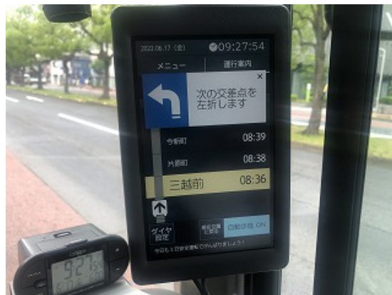
《経路間違いの防止》