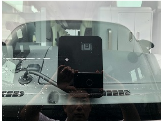
《先進安全自動車 車線逸脱警報装置》