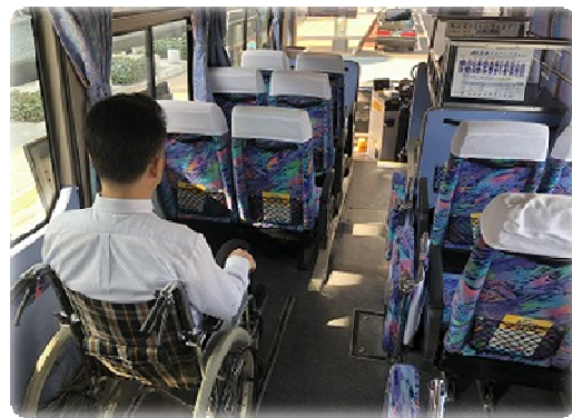
《空港リムジン リフト付きバス》