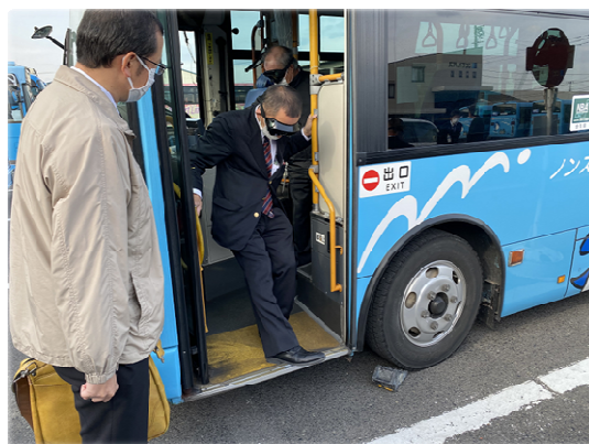
《視覚障がい者サポート講習》