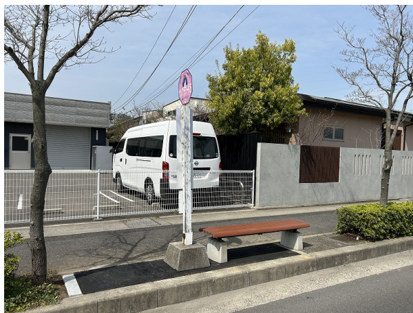
《バス停整備（ベンチ設置）》

2022年度はバス停留所1か所にベンチ1脚を設置しバス待ち環境を向上しました。今後も、お客様がご利用しやすいバスを目指し、バス待ち環境の整備に努めてまいります。