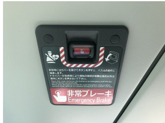
《ドライバー異常時対応システム》