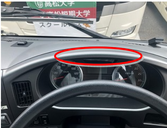
《ドライバーモニター》 (居眠り運転防止装置)