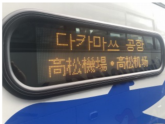
《空港リムジンバス》